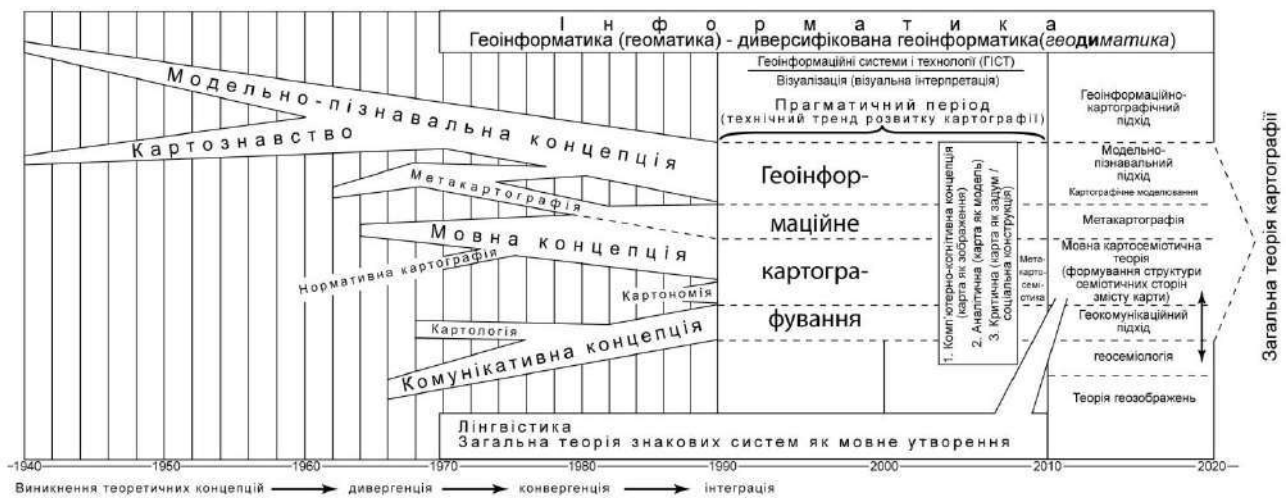
Рис.1. Етапи розвитку теоретичного процесу в картографії.

геоінформаційного картографування. Щодо нього, в роботі Сербенюка С.М. (1990) «Картографія і геоінформатика – їх взаємодія» зроблені фундаментальні узагальнення теорії, методології і практики розвитку географічних інформаційних систем в географічній картографії. Геоінформатика, проявляючи сильний тиск на картографію, поступово сама стає частиною картографії і яскраве свідчення тому - нинішній прогрес геоінформаційного картографування, що спирається на ГІС-технології, бази цифрових даних і систему географічних знань (Берлянт О.М.,1993). Він активно підтримує думку щодо становлення нової геоінформаційної (геоінформаційно-картографічної) концепції, в якій формується особлива система основних положень картографії: науки про системне інформаційно-картографічне моделювання та пізнання геосистем; карта – образно знакова геоінформаційна модель дійсності; сновні напрями теоретичних досліджень – розробка теорії геоінформаційного картографування, картографічного моделювання, картографічних знакових систем, проблем розпізнавання образів; основні контакти картографії – з науками про Землю і суспільство, інформатикою, семіотикою.