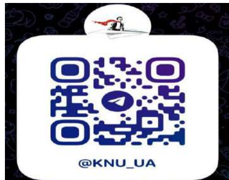
Більше новин КНУ в телеграм каналі