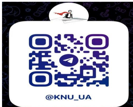
Більше новин КНУ в телеграм каналі