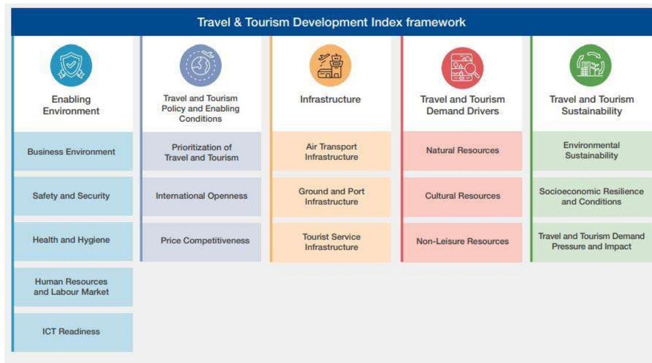
Рисунок 3. Складові індексу розвитку подорожей та туризму (WEF, 2021)

Серія звітів щодо туристичної конкурентоспроможності Світового економічного форуму та оновлений варіант 2021 року дозволяє проаналізувати надання пріоритетності туристичному сектору, міжнародну відкритість, цінову конкурентоспроможність та сталість середовища у країнах світу як складову оцінки конкурентоспроможності (Рис.3).