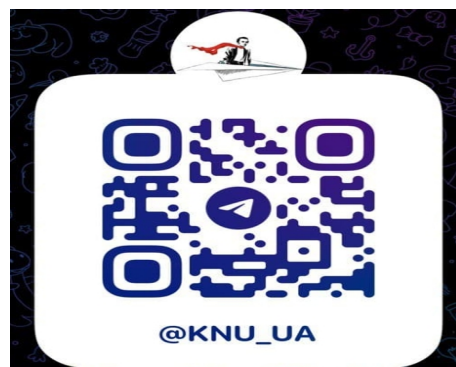
Більше новин КНУ в телеграм каналі